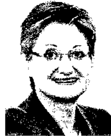
BM Claudia Schmied